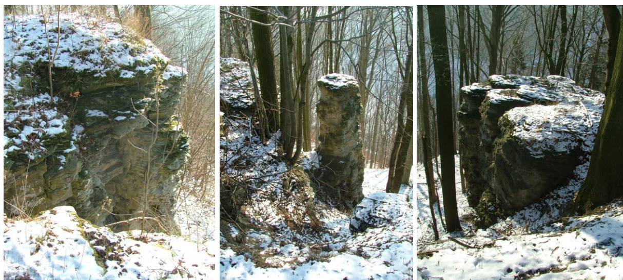
Ukázky skalních srubů a věžiček nad pravým břehem Tiché Orlice