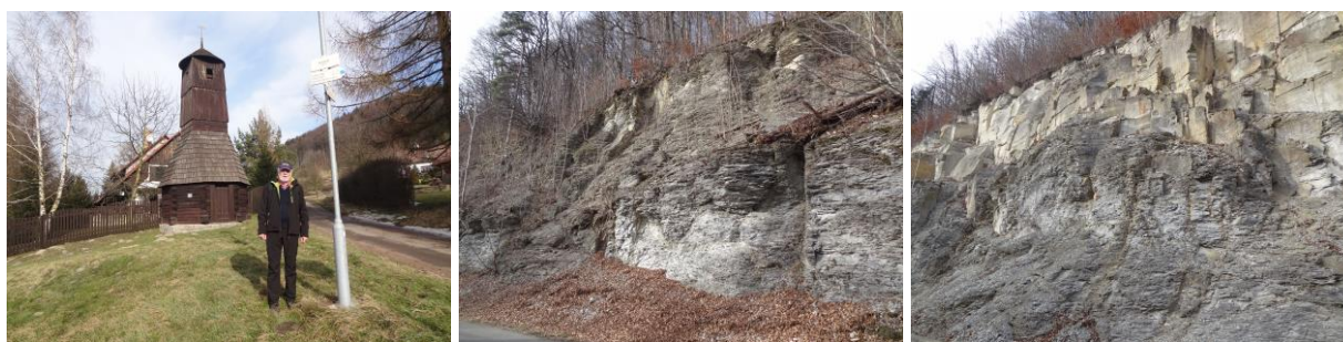
Dřevěná zvonice nad osadou Rviště – Odkryté geologické profily u silnice do Brandýsa