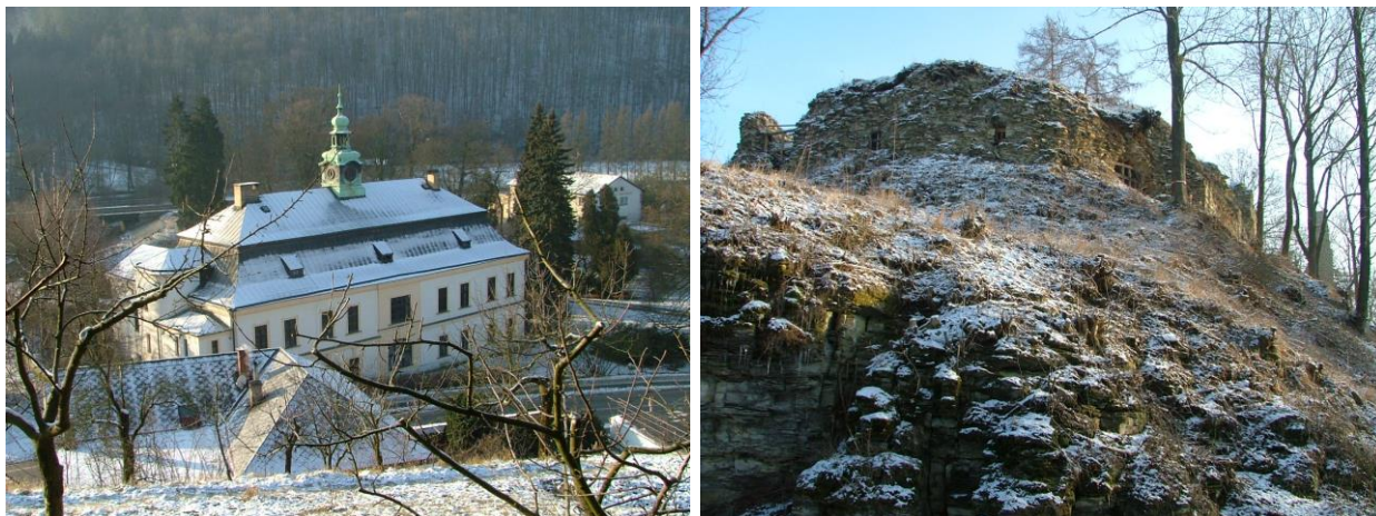
Brandýs nad Orlicí – zámek, hrad